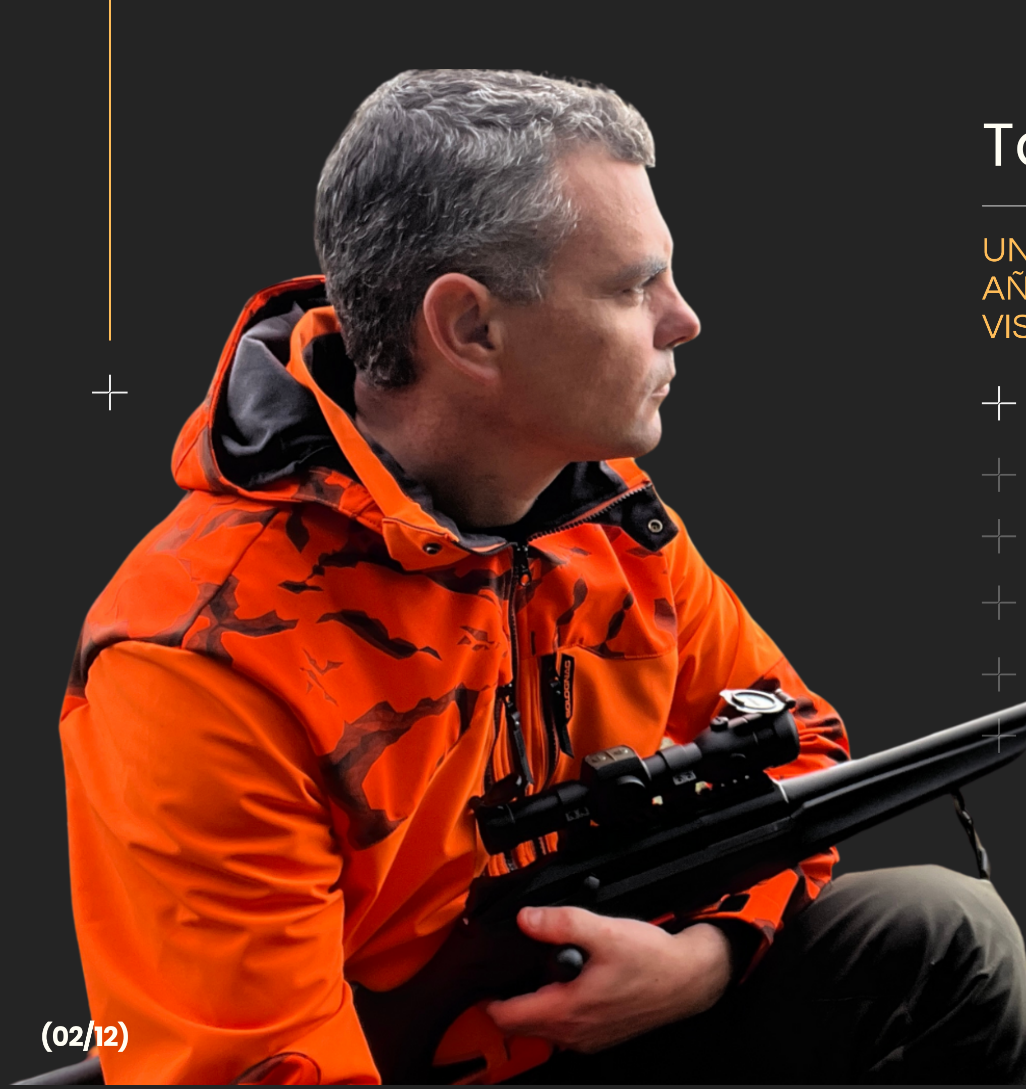
Tabla de contenidos

UN PERFIL POCO HABITUAL Y EL VALOR AÑADIDO QUE TE PUEDO OFRECER, A VISTA DE PÁJARO.